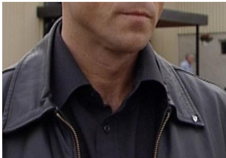
Mayor of Båtsfjord municipality, Geir Knutsen welcomes the expansion of the fishing industry.