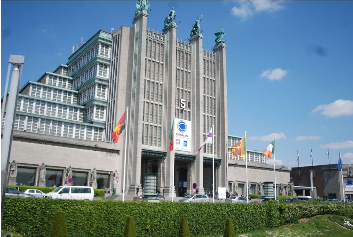
On Tuesday, the seafood fair Seafood Global Expo opens in Brussels, where business actors from the seafood industry all over the world participate.