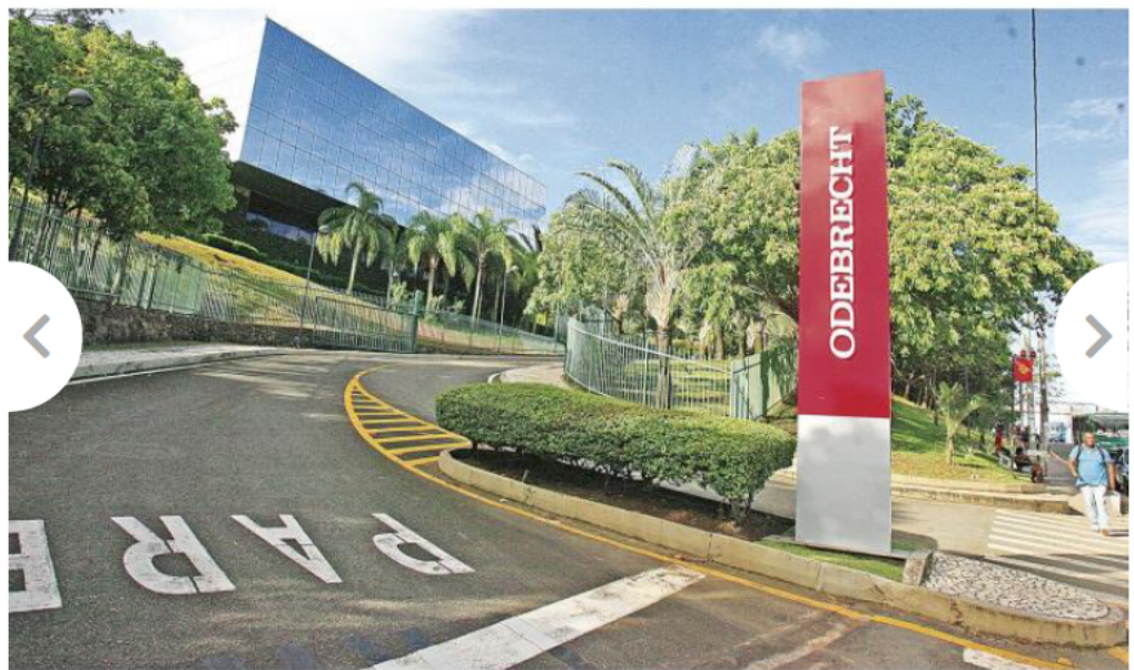
Oficinas de Odebrecht en Brasilia.