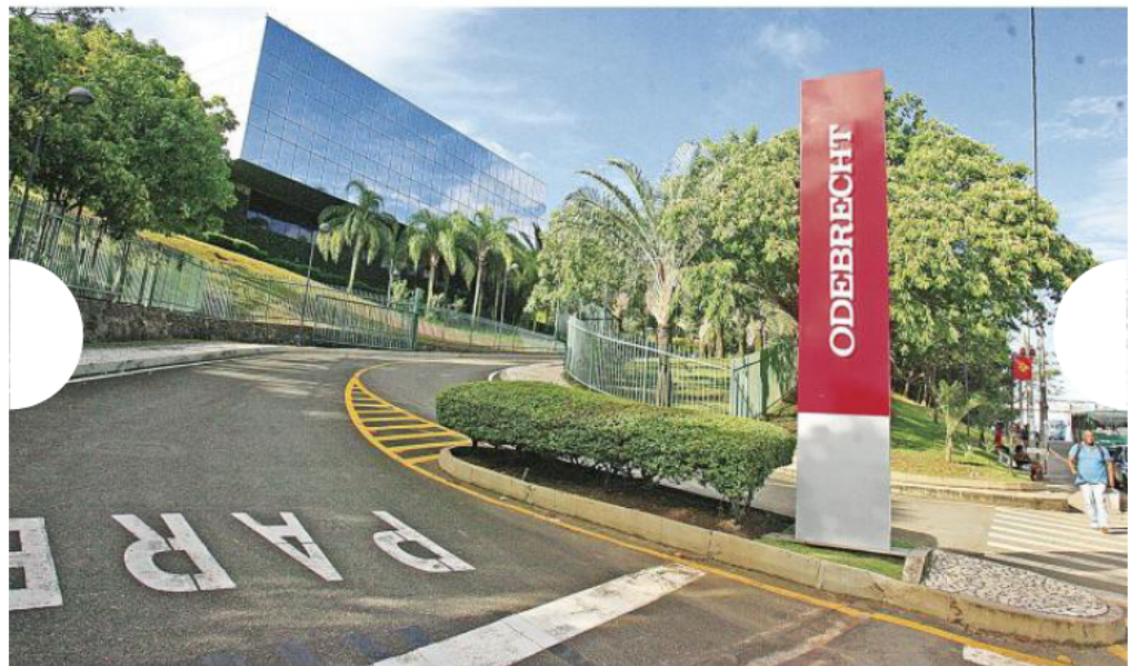
Odebrecht offices in Brazil

Agreement number 3 validated the agreed monetary penalty of $120 million fine, plus $100 million for harm to public finances, from which $10 million was deducted, which had previously been paid by the Odebrecht company, leaving the liquid fine to pay of $210 billion, payable over 12 years. Of this amount, the company has paid $36 million.