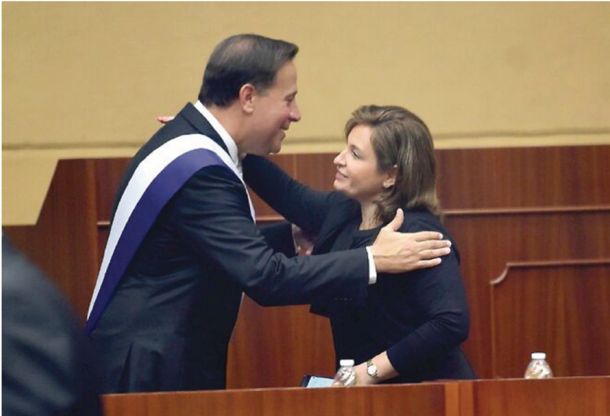
‘Varelaleaks’, política y poder a través del chat