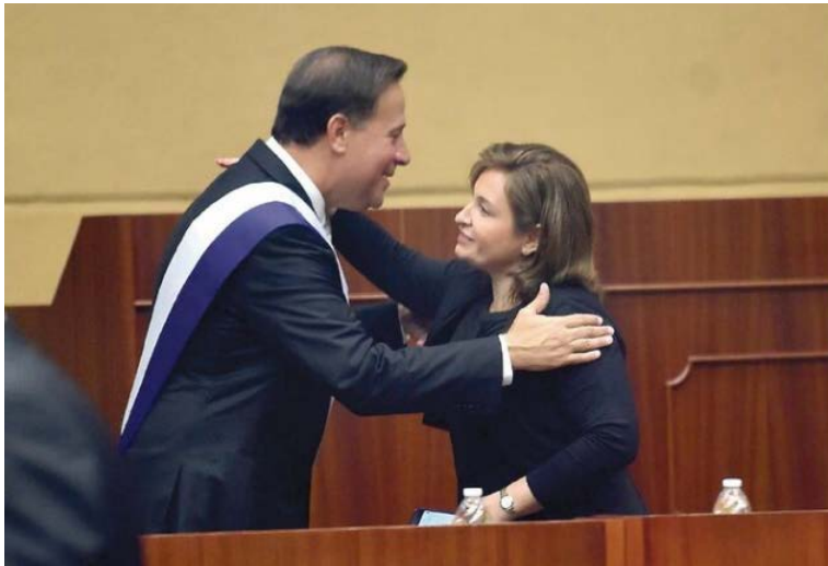
‘Varelaleaks’, politics and power through chat

Eliana Morales Gil 07 Nov 2019 – 12:00 AM