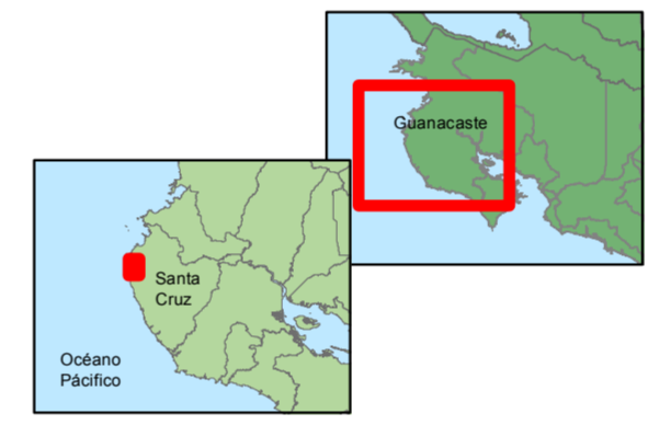
DIAGRAMA DE UBICACIÓN